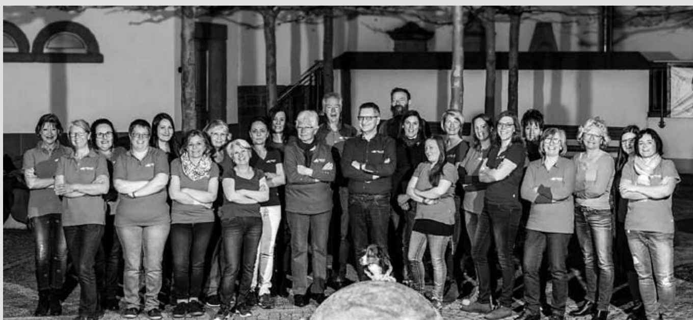
Der Chor im Jubiläumsjahr: