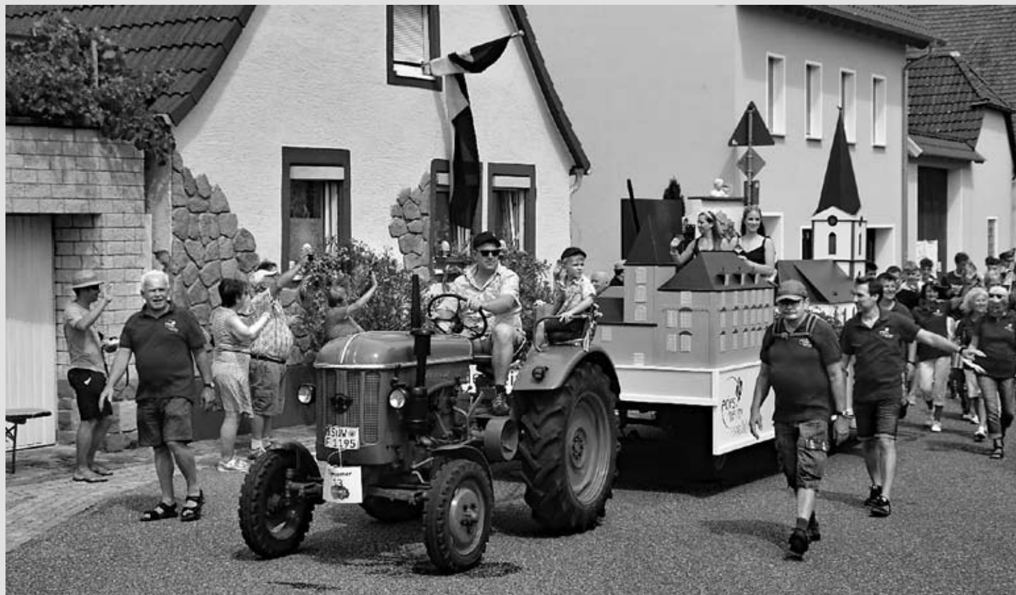
Edesheimer Festwagen beim Jubiläumsumzug in Roschbach